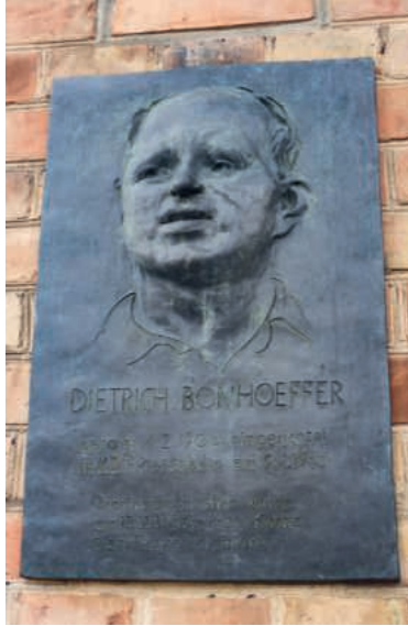
Die Bonhoeffer-Gedenktafel an der St.-Matthäus-Kirche in Berlin-Tiergarten, wo Bonhoeffer 1931 zum Pfarrer ordiniert wurde.

Bonhoeffer wuchs in einer pflichtbewussten Familie des Bürgertums auf. Musik war wichtig, auch Sport, Bildung zuoberst. Religion und Glaube standen nicht im Vordergrund. Vater Karl Bonhoeffer arbeitete als bedeutender Psychiater und Neurologe, die Mutter, Paula Bonhoeffer, geborene von Hase, war Lehrerin. Dietrich wurde als sechstes von acht Kindern 1906 in Breslau geboren. 1912 zog die Familie nach Berlin, wo Bonhoeffer 1923 am Grunewald-Gymnasium das Abitur machte. Seine Entscheidung, Theologie zu studieren, kam eher überraschend und löste in der Familie keine Begeisterung aus. Aber Bonhoeffer hatte sich entschieden, passend zu seinem Konfirmationsspruch: «Denn ich schäme mich des Evangeliums von Christus nicht», ein Paulus-