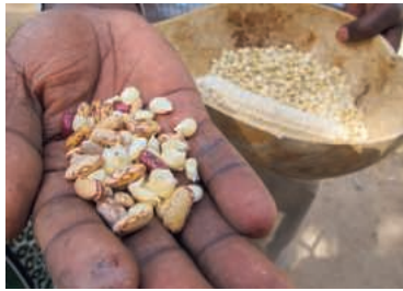
2020 geht es in der Ökumenischen Kampagne um das Saatgut.