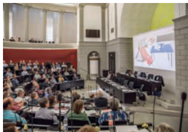
Die Synode tagt jeweils im Kantonsratssaal in Luzern.