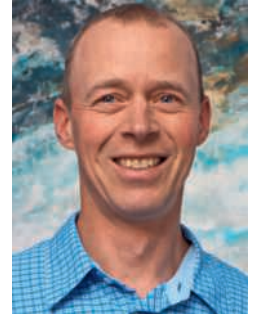
Stefan Sigris Unbebaute Grundstücke